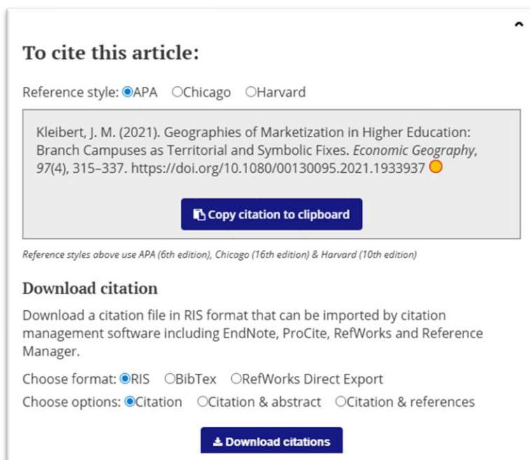
Abbildung 2: Screenshot Fachzeitschrift Economic Geography .

Achtung: Bei der Nutzung von automatisch erstellten Quellen obliegt es Ihnen, die Richtigkeit zu prüfen und ggf. neu zu formatieren.